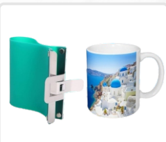
ABRAZADERA (TAZA / 11,5CM / NORMAL) ART. 21304