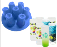
1 MOLDE PARA SUBLIMAR 7 VASOS PEQUEÑOS