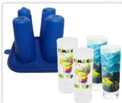
ABRAZADERA (VASO P/ VINO - 4UNID) ART. 21312