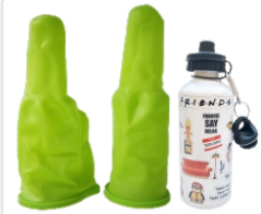
2 MOLDES PARA SUBLIMAR HOPPIS