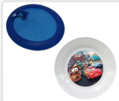
ABRAZADERA (PLATO DE 6 PULGADAS) ART. 21308