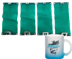
4 ABRAZADERAS PARA SUBLIMAR TAZAS