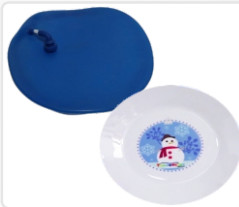
1 MOLDE PARA SUBLIMAR PLATO DE 8" DE DIAMETRO