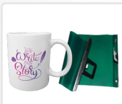
ABRAZADERA (TAZA / 15 ONZAS / NORMAL) ART. 21305