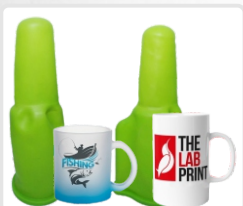
ABRAZADERA PARA TAZAS NORMAL/ALTA ART. 21309/21310