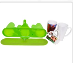
ABRAZADERA (TAZA CÓNICA - 17 ONZAS / 12 ONZAS) ART. 21301