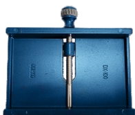
1 SOPORTE PARA SECAR CARCASAS