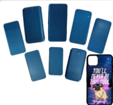
8 MOLDES PARA SUBLIMAR CARCASAS DE CELULAR