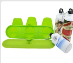
ABRAZADERA (BOTELLA DEPORTIVA - 750ML) ART. 21302