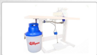
KIT SUCCIÓN ELÉCTRICA (NO NECESITA COMPRESOR) ART. 29391