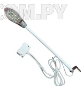
FOCO (18 LED) ART. 13320