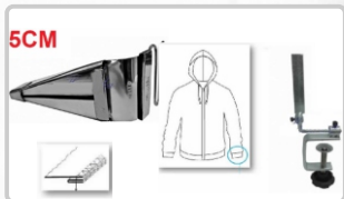
DOBLADILLADOR PARA CUELLO / PUÑO (DISPONIBLE EN VARIAS MEDIDAS)