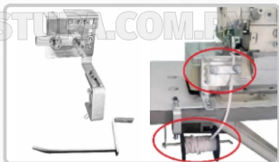
GUIADOR INFERIOR PARA ELÁSTICO (ART. 18316)