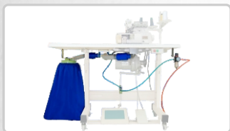
KIT SUCCIÓN NEUMÁTICA (CON LEVANTA PRENSATELA) ART. 18907