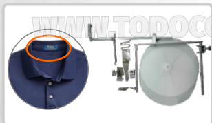
DOBLADILLADOR PARA PEGAR CUELLO POLO EN UNA OPERACIÓN OVERLOCK (ART. 21514)