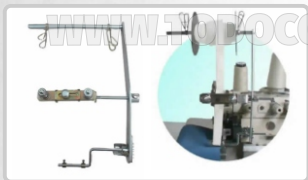
GUIADOR SUPERIOR PARA ELÁSTICO (ART. 18315)