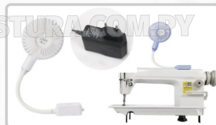
VENTILADOR (ART. 21361)