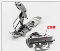
PRENSATELA PARA VIVO