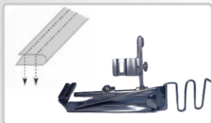
DOBLADILLADOR VIVO PARA OVERLOCK (DISPONIBLE EN VARIAS MEDIDAS)