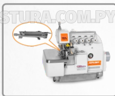
KIT CORTA HILO (NECESARIO COMBINAR CON KIT DE SUCCIÓN)