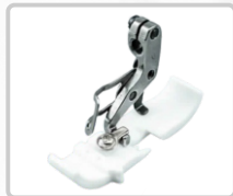
PRENSATELA DE TEFLÓN