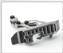
PRENSATELA CON RODILLO (PARA MEJOR ARRASTRE)