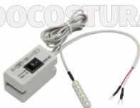
FOCO (8) LED WILLPEX (CON LLAVE) ART. 13320