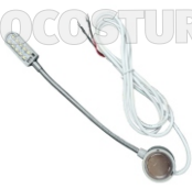
FOCO (10 LED) ART. 17151