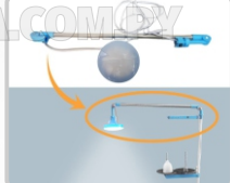
FOCO LED (GRANDE) ART. 29832