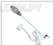
FOCO (18 LED) ART. 13320