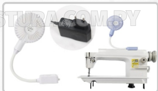
VENTILADOR (ART. 21361)