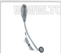
FOCO 12 LED CON IMÁN ART. 14644