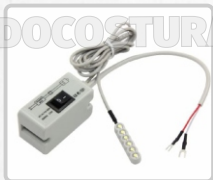
FOCO (B) LED WILLPEX (CON LLAVE)