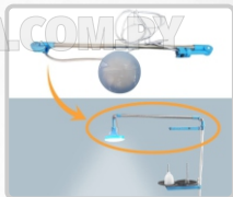
FOCO LED (GRANDE) ART. 29832