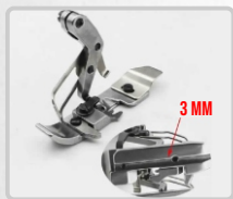
PRENSATELA PARA VIVO