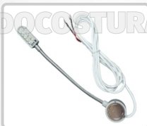
FOCO (10 LED) ART. 17151