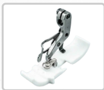
PRENSATELA DE TEFLÓN