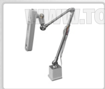
FOCO LED GRANDE ART. 16921