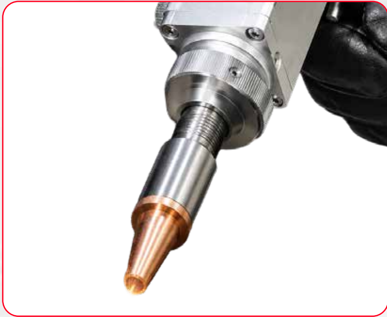
DIÁMETRO PUNTO FOCAL: 0,2 A 2,0MM