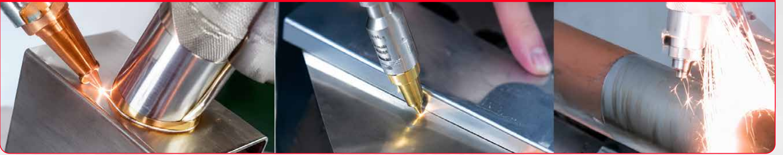
FUNCIÓN 1 UNIR METAL