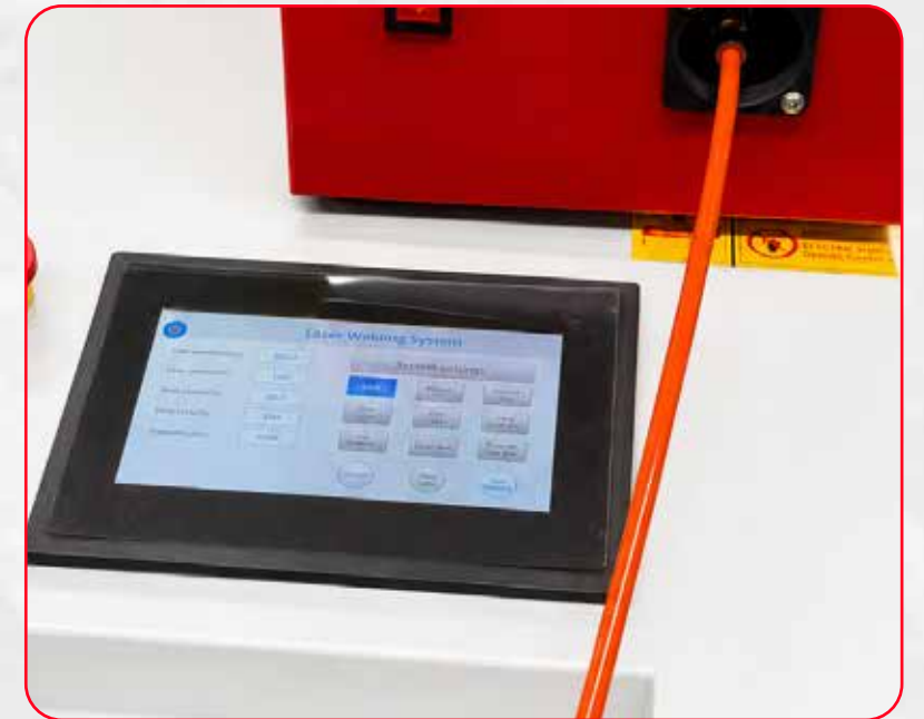
PANEL DE CONTROL INTELIGENTE TÁCTIL, DE FÁCIL OPERACIÓN