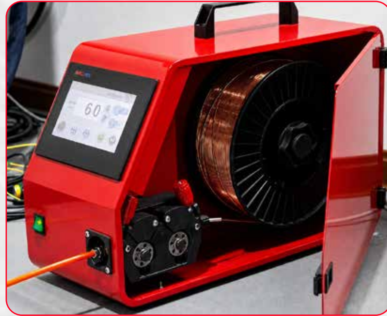
ALIMENTADOR AUTOMÁTICO DE ALAMBRE, PARA DAR MAYOR RESISTENCIA A LA SOLDADURA