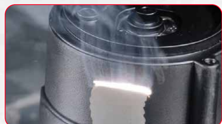
MUESTRA DE LIMPIEZA