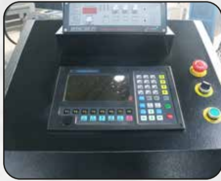
CONSOLA CNC + THC CONTROL TOTAL DEL PROCESO DE CORTE