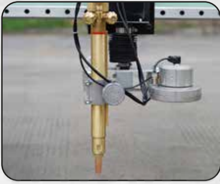
FUNCION 1: CABEZAL DE OXICORTE OXÍGENO Y GAS CNC