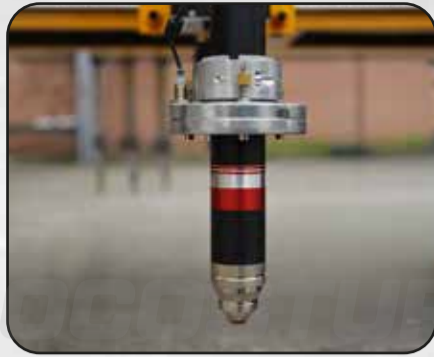
FUNCION 2: CABEZAL DE CORTE PLASMA CNC