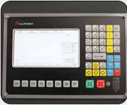
CONTROL CNC STARFIRE PROGRAMACIÓN Y OPERACIÓN PRECISA