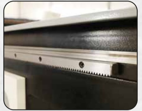
SISTEMA DE TRANSMISIÓN CREMALLERA HELICOIDAL DE ALTA PRECISIÓN