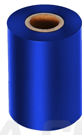
CINTA RIBBON AZUL 20MM X 50 METROS ART.32389