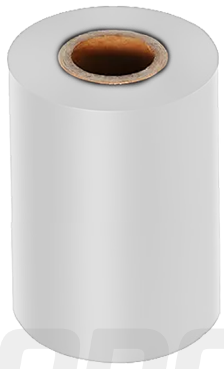
CINTA RIBBON BLANCO 20MM X 50 METROS ART.32389