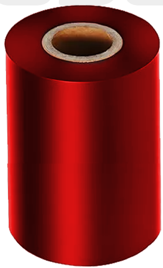
CINTA RIBBON ROJO 20MM X 50 METROS ART.32386