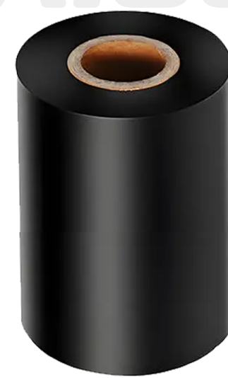
CINTA RIBBON NEGRO 20MM X 50 METROS ART.32388