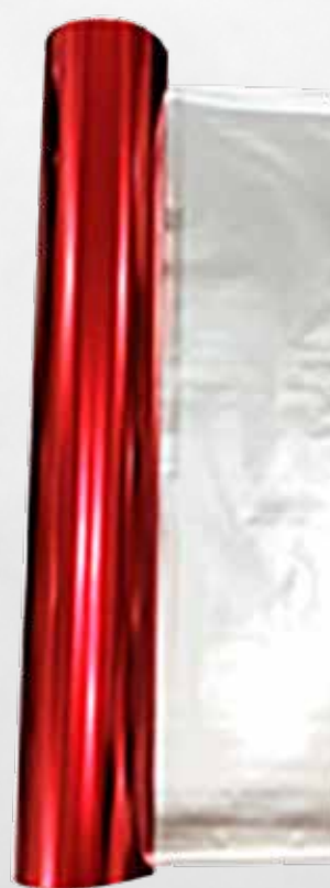
CINTA FOIL ROJO (20CM X 50 METROS) P/ TRANSFER FOIL WILLPEX NDL-360C ART.32375

*LAS IMÁGENES SON MERAMENTE ILUSTRATIVAS Y PUEDEN NO CONSTITUIR LA REPRESENTACIÓN EXACTA DEL PRODUCTO.