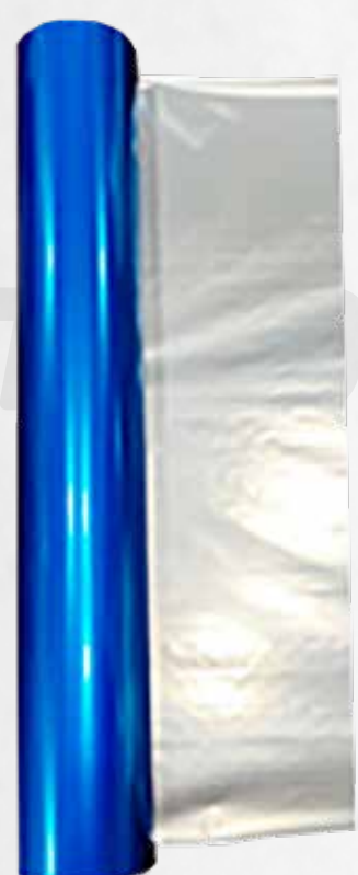
CINTA FOIL AZUL (20CM X 50 METROS) P/ TRANSFER FOIL ART.32377