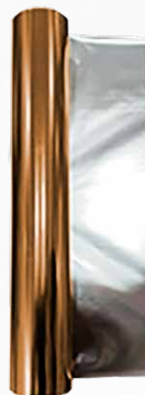
CINTA FOIL BRONCE (20CM X 50 METROS) P/ TRANSFER FOIL ART.32378