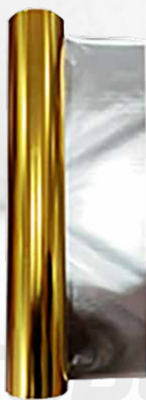
CINTA FOIL DORADO (20CM X 50 METROS) P/ TRANSFER FOIL ART.32379