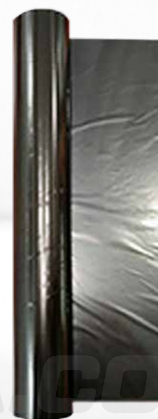
CINTA FOIL NEGRO (20CM X 50 METROS) P/ TRANSFER FOIL ART.32376