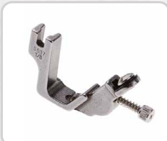
PIE PARA AÑADIR ELÁSTICO (MEDIDAS VARIAS)