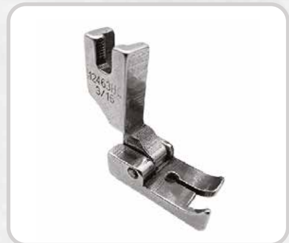
PIE CON GUÍA (PATA DE CABRA) (MEDIDAS VARIAS)