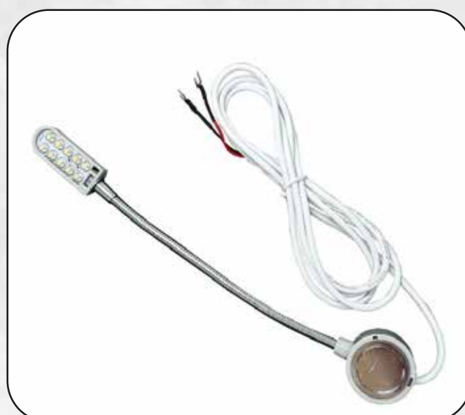
FOCO (10 LED) ART.17151