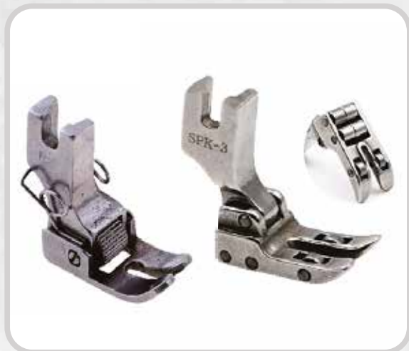
PIE CON RODILLO (PARA MEJOR ARRASTRE)