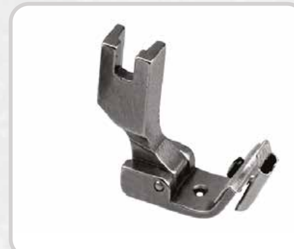
PRENSATELA PARA CINTA (AJUSTABLE)