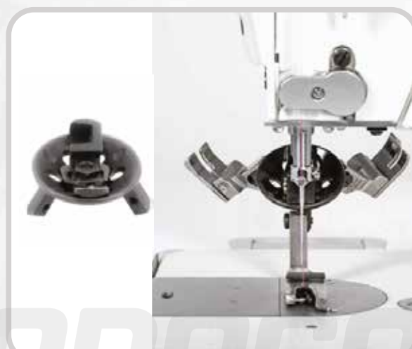
SOPORTE DE PRENSATELA (3 EN 1)