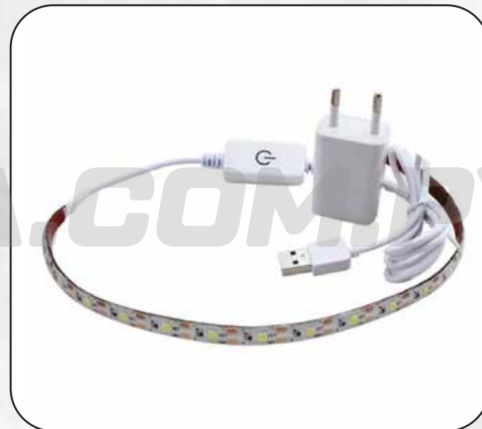
FOCO CINTA LED ART.29798