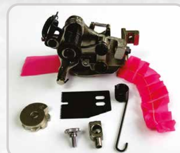
PLISADOR (4-8 PUNTADAS)