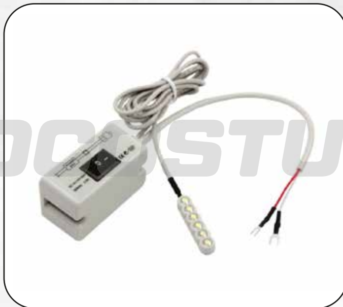
FOCO (B) LED WILLPEX (CON LLAVE) ART.16819