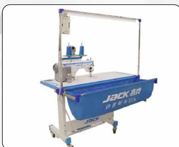
CANASTA (CON LED) PARA MESADA DE MAQUINA INDUSTRIAL ART.29231

*LAS IMÁGENES SON MERAMENTE ILUSTRATIVAS Y PUEDEN NO CONSTITUIR LA REPRESENTACIÓN EXACTA DEL PRODUCTO.