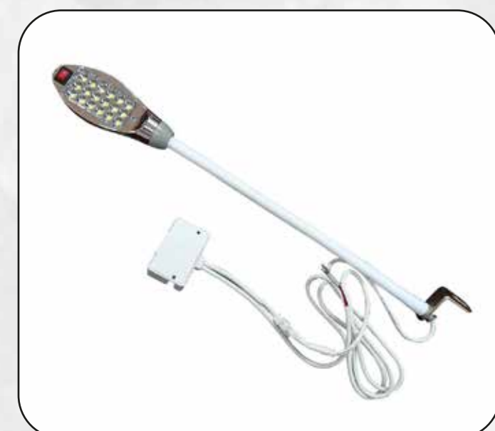
FOCO (18 LED) ART.13320