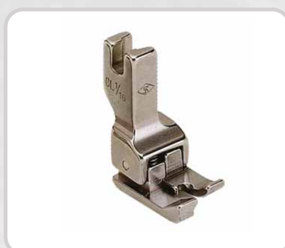
PIE COMPENSADO (VARIAS MEDIDAS)