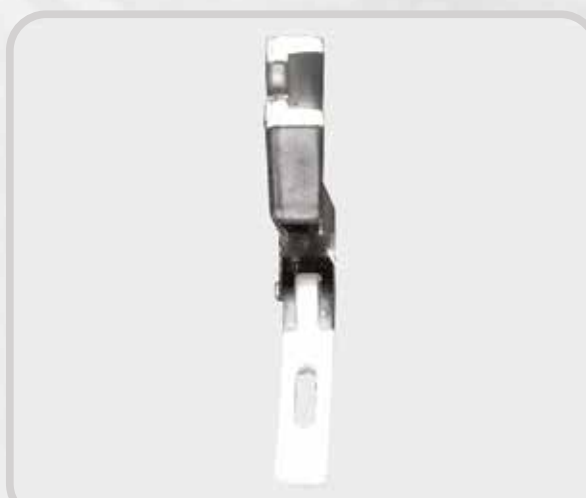
PRENSATELA FINA TEFLÓN (PARA CIERRE)