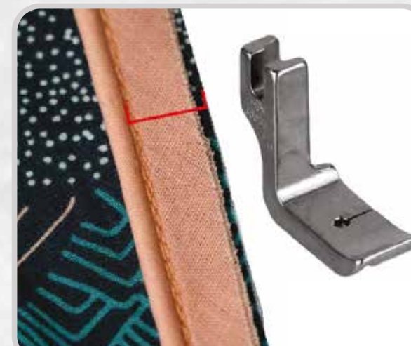
PIE PARA VIVO (MEDIDAS VARIAS)