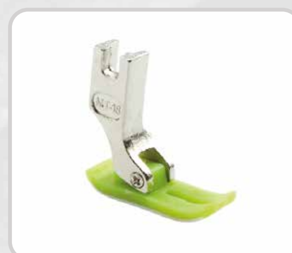
PIE DE TEFLÓN