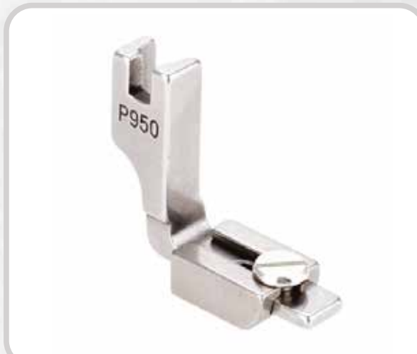
PIE PARA FRUNCIR (AJUSTABLE)