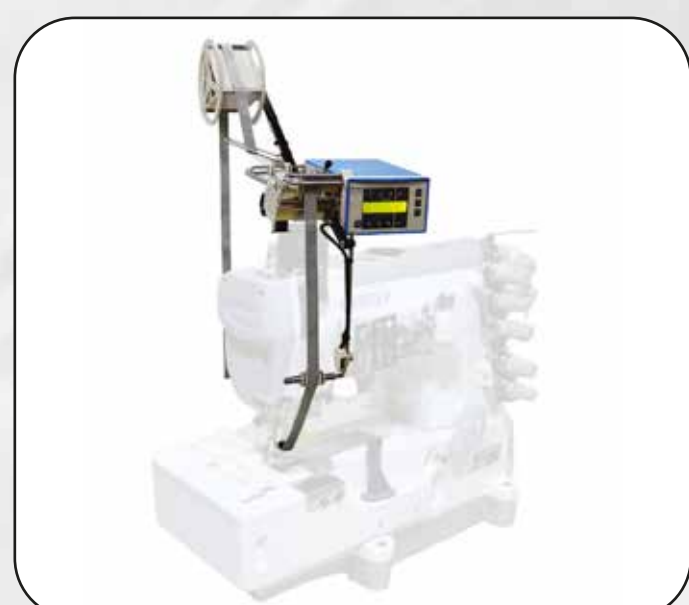
ALIMENTADOR DE BIES PARA ELÁSTICOS / CINTAS ART.16921