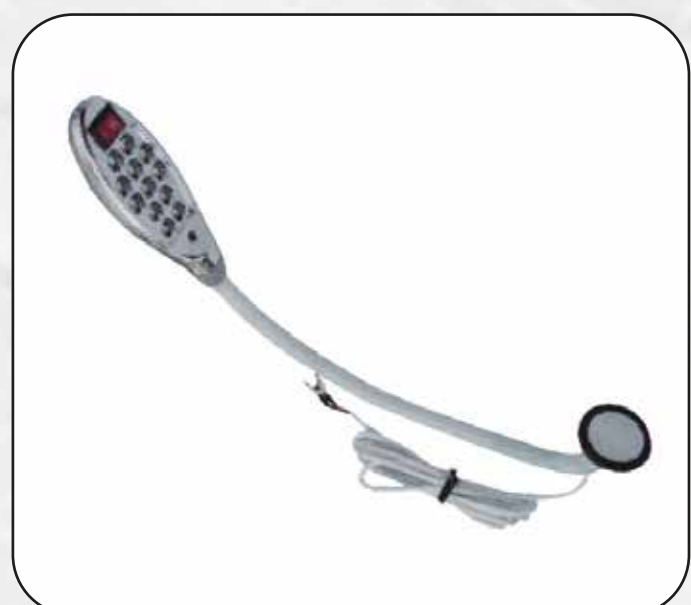
FOCO 12 LED CON IMÁN ART.14644