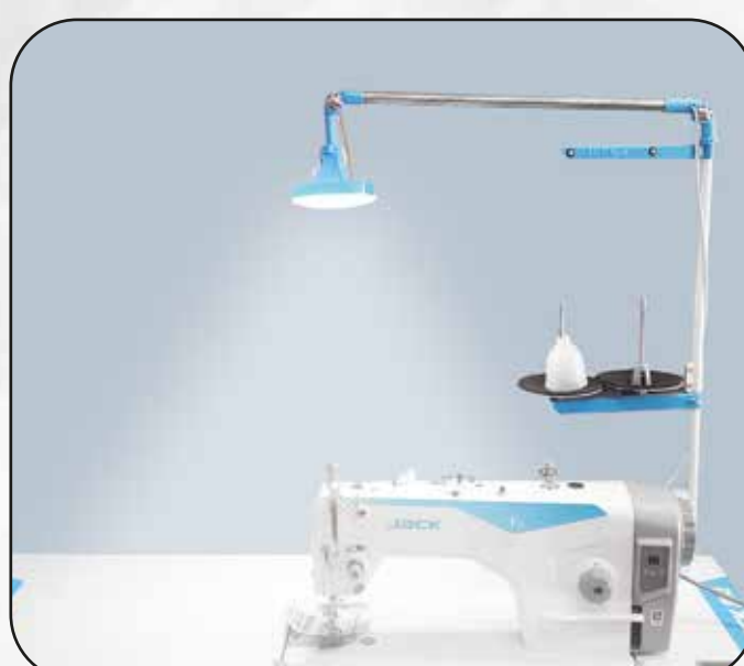
FOCO LED (GRANDE) ART.29832