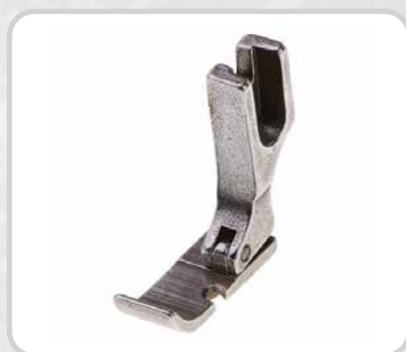
PIE PARA CIERRE INVISIBLE