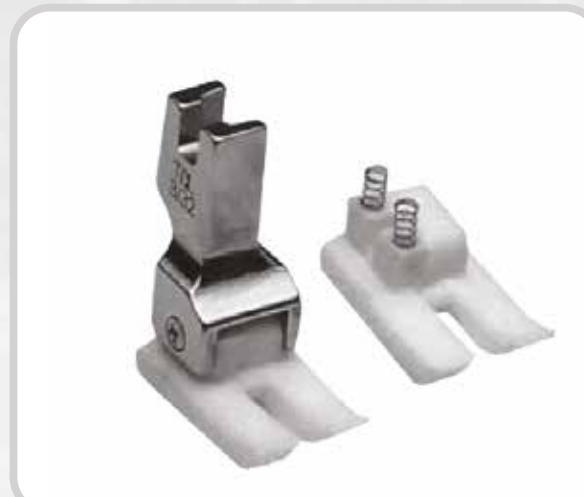
PRENSATELA COMPENSADO (TEFLÓN)