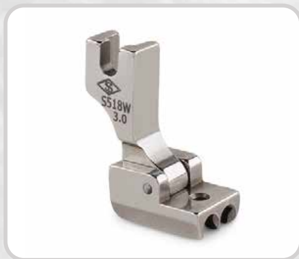
PIE CIERRE NORMAL IZQ/DER