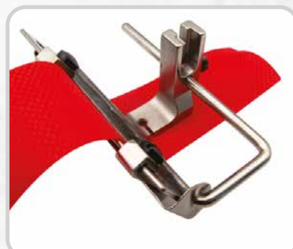
PRENSATELA AJUSTABLE PARA TIRAS