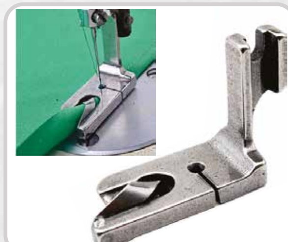
PIE PARA DOBLADILLADOR (VARIAS MEDIDAS)