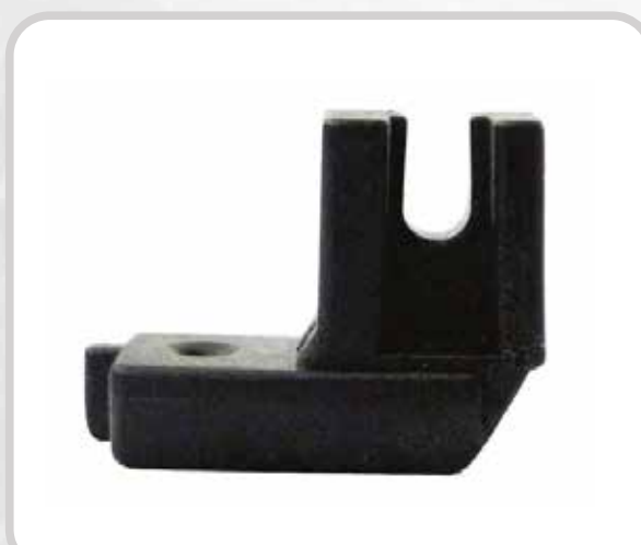
PRENSATELA CIERRE INVISIBLE (TEFLÓN)