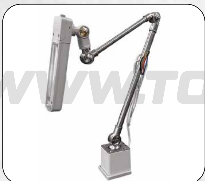
FOCO LED GRANDE ART.16921