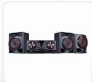
OTROS APARATOS ELECTRÓNICOS