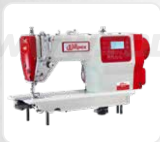
MÁQUINAS DE COSER