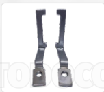
CHAPA ARASTRRE + PRENSATELA (VERTICAL - 38 MM)