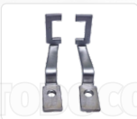
CHAPA ARRASTRE + PRENSATELA (16 X 16 MM)