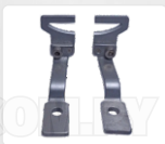
CHAPA ARRASTRE + PRENSATELA (D - 32 X 8 MM)