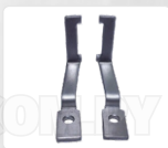
CHAPA ARASTRRE + PRENSATELA (VERTICAL - 22 MM)