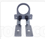
CHAPA ARRASTRE + PRENSATELA CIRCULAR 25 MM