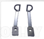
CHAPA ARASTRRE + PRENSATELA (DOBLE D)