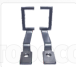
CHAPA ARASTRRE + PRENSATELA (27 X 27 MM)