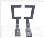
CHAPA ARRASTRE + PRENSATELA (40 X 30)