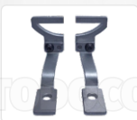
CHAPA ARRASTRE + PRENSATELA (D - 38 X 9 MM)