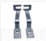
CHAPA ARASTRRE + PRENSATELA (25 MM)