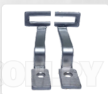
CHAPA ARRASTRE + PRENSATELA (38 MM)