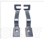
CHAPA ARASTRRE + PRENSATELA (21 MM)