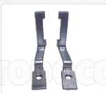
CHAPA ARASTRRE + PRENSATELA (VERTICAL - 27 MM)