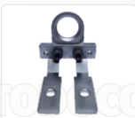
CHAPA ARRASTRE + PRENSATELA 17MM