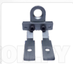
CHAPA ARRASTRE + PRENSATELA 12MM