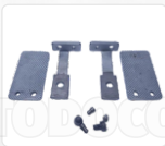
CHAPA ARASTRRE + PRENSATELA (BLANK)