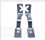
CHAPA ARASTRRE + PRENSATELA (X)