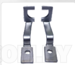
CHAPA ARRASTRE + PRENSATELA (D - 18MM)