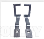
CHAPA ARASTRRE + PRENSATELA (25 X25 MM)

*LAS IMÁGENES SON MERAMENTE ILUSTRATIVAS Y PUEDEN NO CONSTITUIR LA REPRESENTACIÓN EXACTA DEL PRODUCTO.