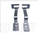
CHAPA ARRASTRE + PRENSATELA (30 MM)

*LAS IMÁGENES SON MERAMENTE ILUSTRATIVAS Y PUEDEN NO CONSTITUIR LA REPRESENTACIÓN EXACTA DEL PRODUCTO.