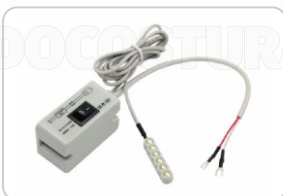
FOCO (B) LED WILLPEX (CON LLAVE) ART. 16819