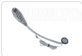
FOCO 12 LED CON IMÁN ART. 14644