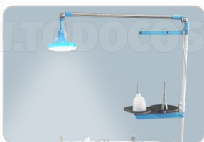
FOCO LED (GRANDE) ART. 29832