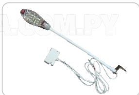
FOCO (18 LED) ART. 13320