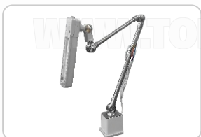
FOCO LED GRANDE ART. 16921