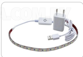
FOCO CINTA LED ART. 29798