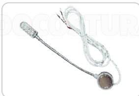
FOCO (10 LED) ART. 17151