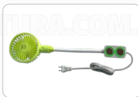
VENTILADOR ART. 21361

*LAS IMÁGENES SON MERAMENTE ILUSTRATIVAS Y PUEDEN NO CONSTITUIR LA REPRESENTACIÓN EXACTA DEL PRODUCTO.