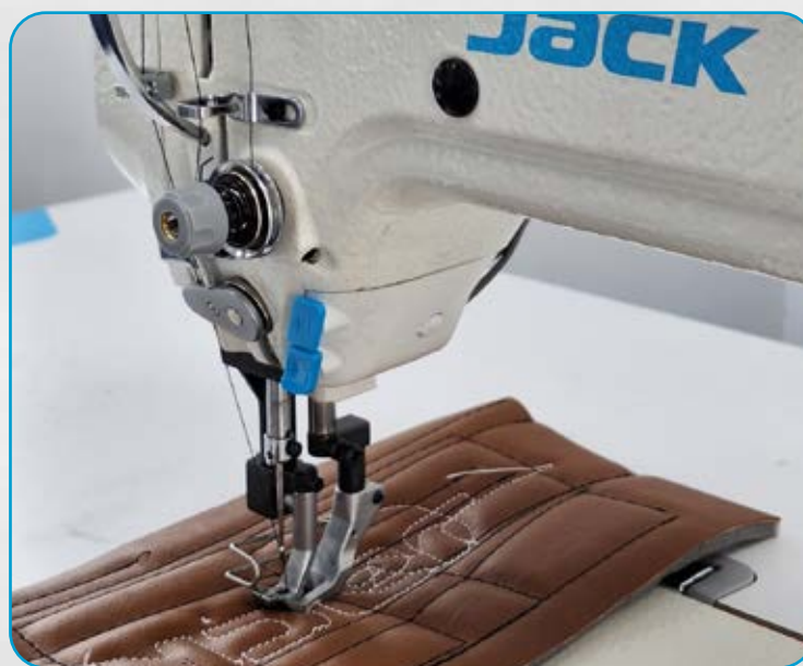
TODA LA POTENCIA, ESPECIAL PARA CUERO