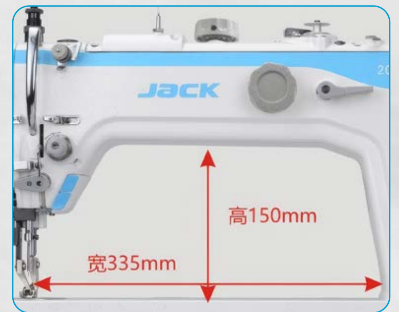
GRAN ESPACIO BAJO EL BRAZO PARA MATERIALES DE MAYOR VOLUMEN