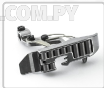
PRENSATELA CON RODILLO (PARA MEJOR ARRASTRE)