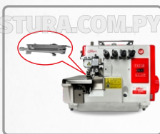
KIT CORTA HILO (NECESARIO COMBINAR CON KIT DE SUCCIÓN)