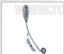
FOCO 12 LED CON IMÁN ART. 14644