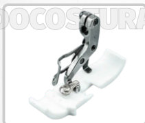
PRENSATELA DE TEFLÓN