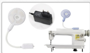
VENTILADOR (ART. 21361)