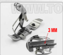
PRENSATELA PARA VIVO