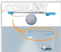
FOCO LED (GRANDE) ART. 29832