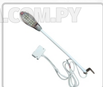
FOCO (18 LED) ART. 13320