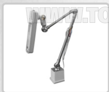
FOCO LED GRANDE ART. 16921