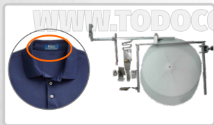
DOBLADILLADOR PARA PEGAR CUELLO POLO EN UNA OPERACIÓN OVERLOCK (ART. 21514)