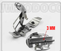
PRENSATELA PARA VIVO