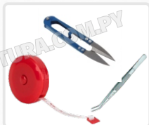
CINTA MÉTRICA PINZA DE ENHEBRAR TIJERA DE ASEO