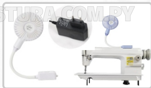
VENTILADOR (ART. 21361)