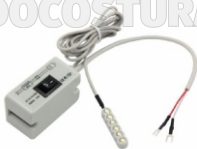
FOCO (B) LED WILLPEX (CON LLAVE) ART. 13320