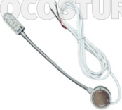
FOCO (10 LED) ART. 17151