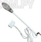
FOCO (18 LED) ART. 13320