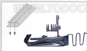
DOBLADILLADOR VIVO PARA OVERLOCK (DISPONIBLE EN VARIAS MEDIDAS)