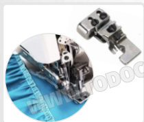
PRENSATELA PARA FRUNCIR