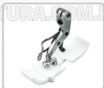
PRENSATELA DE TEFLÓN