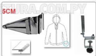
DOBLADILLADOR PARA CUELLO / PUÑO (DISPONIBLE EN VARIAS MEDIDAS)