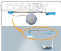
FOCO LED (GRANDE) ART. 29832