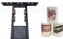
EJE ROTATIVO PARA TAZAS