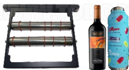
EJE ROTATIVO PARA BOTELLAS