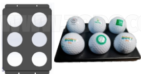
PLATINA PARA PELOTAS DE GOLF