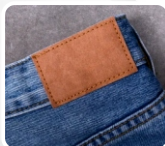
ETIQUETAS EN JEANS