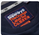
PEGADO DE ETIQUETAS EN REMERAS